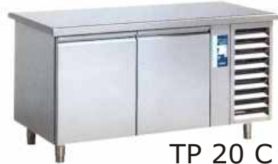
TP 20 C

Wszystkie spełniają wymagania cukierników i są dostępne zarówno jako stoły z wbudowanymi konserwatorami i jako pionowe, modułowe chłodnie (konserwatory).