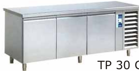
TP 30 C