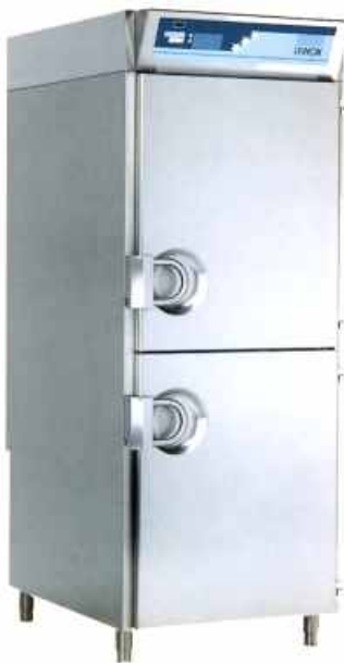
CP 40 C