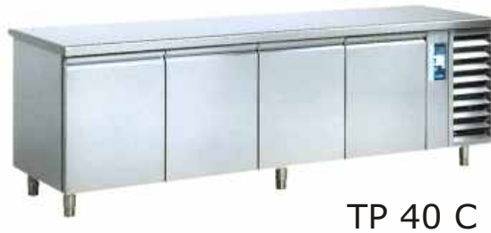
TP 40 C